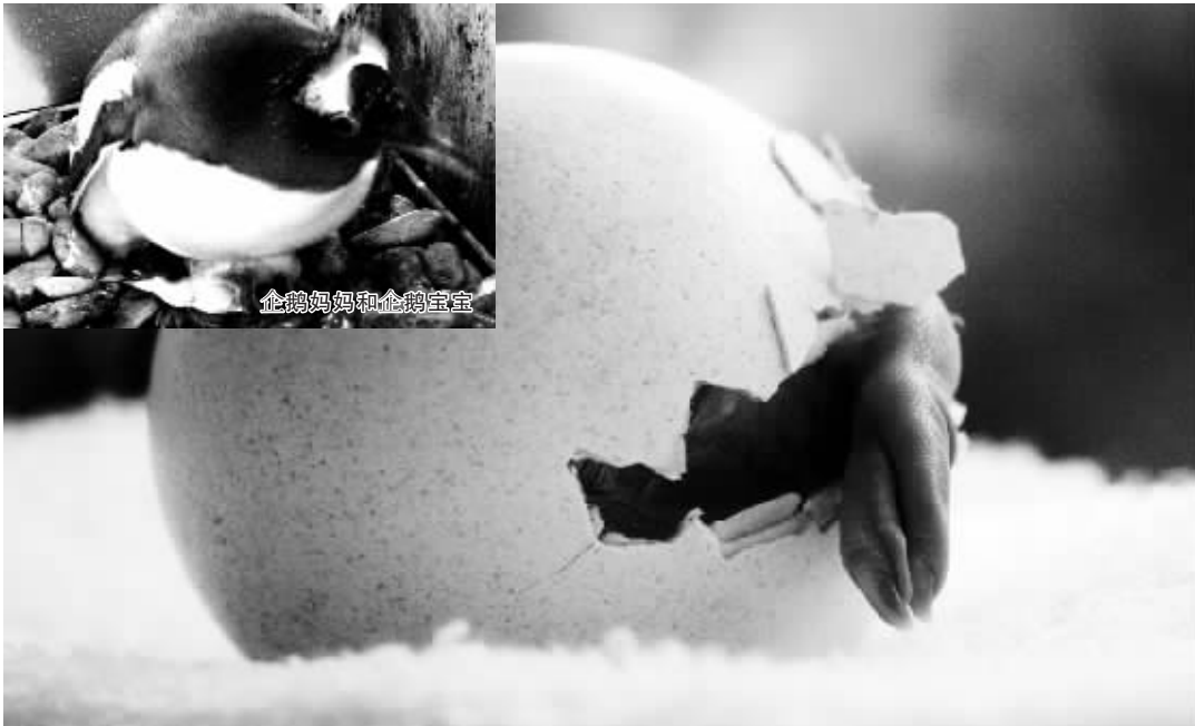
企鹅妈妈和企鹅宝宝

11 个招聘单位分别是郑州市儿童福利院、郑州市社会福利院、郑州市第八人民医院、郑州市第一按摩医院、郑州市嵩山医院、郑州市安全生产应急救援指挥中心、郑州市煤炭监管执法大队、郑州市动物卫生监督所、郑州市动物疫病预防控制中心、郑州市兽药饲料监察所、郑州市畜牧技术推广站。市民可以登录郑州人事人才网、郑州人事考试网查询招聘职位的具体信息。 晚报记者 陈静