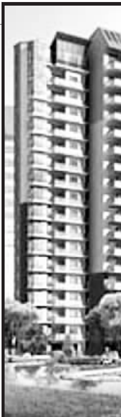
康桥·上城品让我们知道,生活不仅仅是柴米酱醋,生活还有无限的艺术美感。