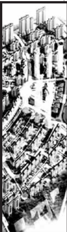
远大·理想城纯粹的地中海闲适风情及独有的人文环境让郑州市民领略到了它的高品质。