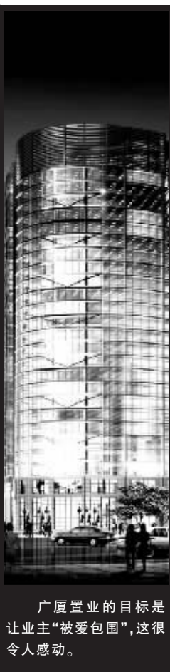
广厦置业的目标是让业主“被爱包围”,这很令人感动。