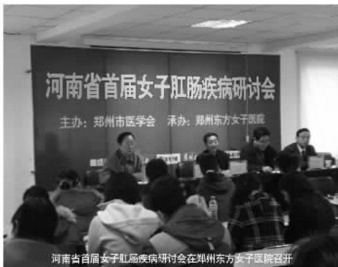
河南省首届女子肛肠疾病研讨会在郑州东方女子医院召开

郑州东方女子医院肛肠科专家介绍, 近期到医院咨询怀孕期间痔疮发作问题的患者着实不少, 部分症状还非常严重, 直接影响到孕期的正常生活。专家提醒女性, 在准备怀孕前应当先到正规医院