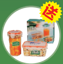
送 香港乐亿多保鲜盒套装 密封卓越/美观实用