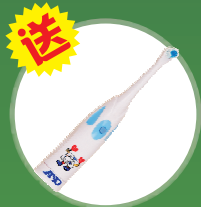
送 香港信利电动牙刷 强力洗净/小巧方便