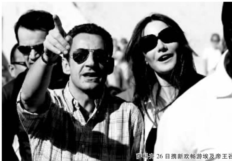
萨科齐 26 日携新欢畅游埃及帝王谷

法国总统尼古拉·萨科齐 12 月 26 日继续与新女友卡拉·布吕尼游览埃及南部历史名城卢克索。这是两人继本月 15 日公开游览巴黎迪斯尼乐园之后第二次高调出现在公众面前。卡拉·布吕尼因此再次吸引公众和媒体的广泛关注。