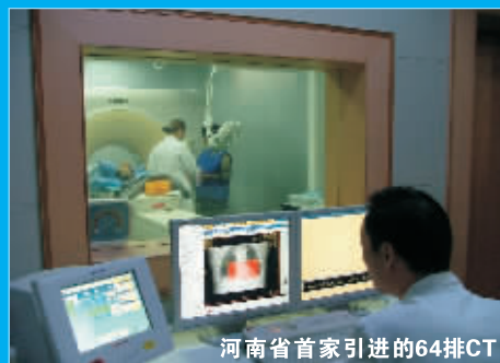
河南省首家引进的64排CT

2005年7月,武警医院率先在河南首家引进64排CT并成立中原地区首家“无创心脑血管成像中心”。目前已完成冠心病、头颈部血管瘤、畸形、狭窄、梗塞、大动脉炎、动脉夹层、动脉瘤、肾血管性高血压、糖尿病等全身性血管疾病检查诊断2万余人次,领先行业两年的技术优势,誉满中原大地!