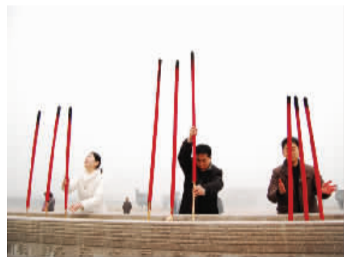
三位伙伴在祭祖香炉中上香