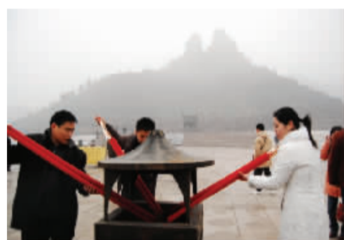
三位伙伴为祭祖在点香炉前点香