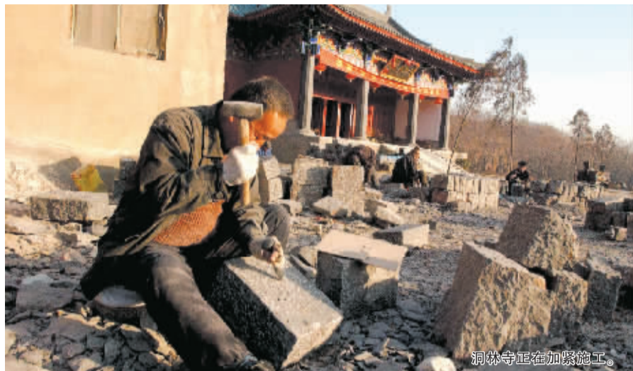
洞林寺正在加紧施工。

的文化。当然,最主要的学习内容还是佛学。其他科目将从社会其他大学聘请来兼职老师教授。释延若说,重庆佛学院以汉语为主,而在建的洞林寺佛学院,将以南传(泰国缅甸语)、北传(中国内地语)、藏传(藏语)3 个语种分别来教学。除预科班和本科班外,还设立 3 年制研究生班,只对出家人招生。另外还设有居士(俗家)培训班。“学校建成后最少可容纳 1 万名学员。”