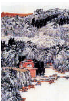
化建国 《古人诗意图》