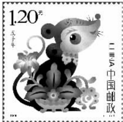
活泼可爱的鼠年邮票。