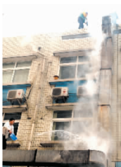
饭店厨师用脸盆灭火。