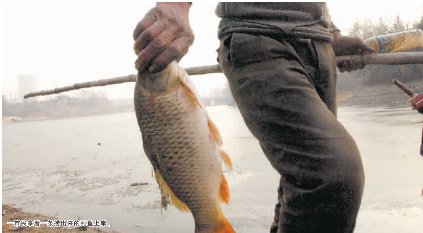
一市民拿着一条捞出来的死鱼上岸。