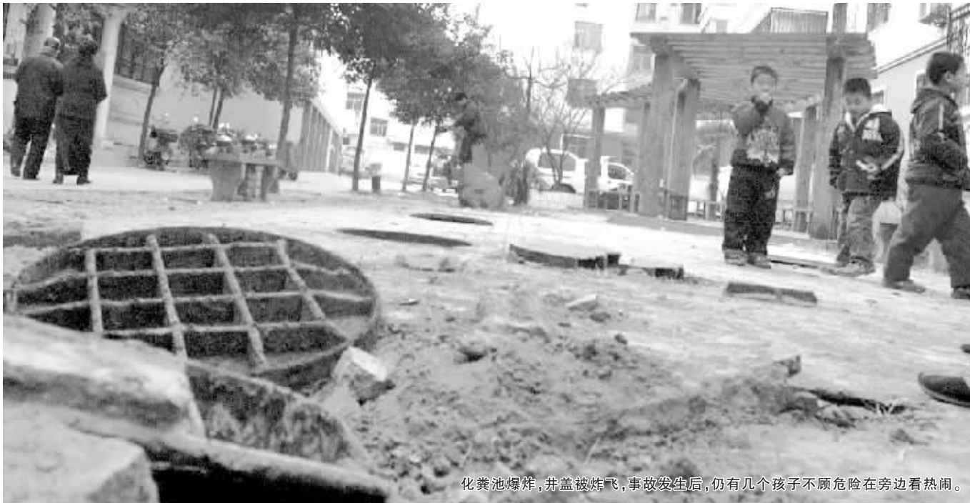
化粪池爆炸,井盖被炸飞,事故发生后,仍有几个孩子不顾危险在旁边看热闹。