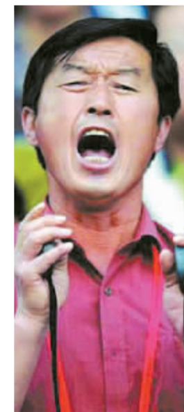
昔日的冠军教头马俊仁