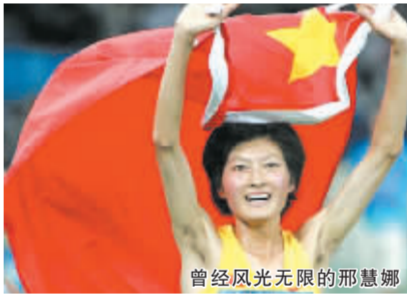
曾经风光无限的邢慧娜

回忆十几年前的马家军在奥运赛场是何等威风?而2008年北京奥运会,已经今非昔比的女子中长跑如何在赛场为国人争金夺银?上周末进行的厦门国际马拉松赛上,孙英杰的复出成了焦点,虽然她连前八都没进,风头却盖过了创赛会纪录夺冠的张莹莹。对青黄不接的中国女子中长跑而言,由停赛两年后复出的孙英杰来担负起这次奥运冲击名次的任务,不知道是不是一种无奈。邢慧娜夺得雅典奥运会冠军是中国女子中长跑在世界大赛上最后的风光。孙英杰被禁赛;邢慧娜深受伤病困扰,从国家队到省队,教练也几度更换,至今连奥运会的A标都还没达到。2007年4月,邢慧娜的5000米成绩是15分36秒94,距离世锦赛B标还差12秒,距离大阪世锦赛夺冠的德费尔差了39秒。中国女子中长跑正面临青黄不接的尴尬局面。薛飞现在(5000米)的成绩,比冠军差两分多钟,就等于差了两圈。本报奥运联盟报道