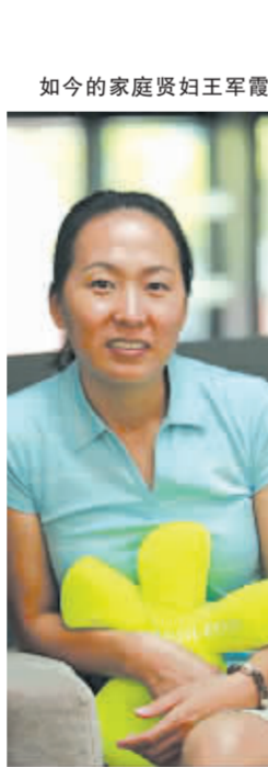
如今的家庭贤妇王军霞