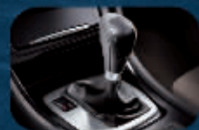
5速手自一体变速箱