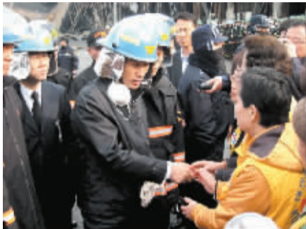
1月8日下午,韩国当选总统李明博(中)与利川市救援人员握手。

7日上午,位于韩国京畿道利川市户法面柳山里的冷冻物流仓库“KOREA2000”发生重大火灾。在堆满化学物质的冷冻仓库里,工人们没带一件像样的安全装备工作,现场的洒水装置等灭火安全设备根本没有启动。该企业对安全问题麻木不仁的做法,再次酿成夺走多人性命的大型惨案。