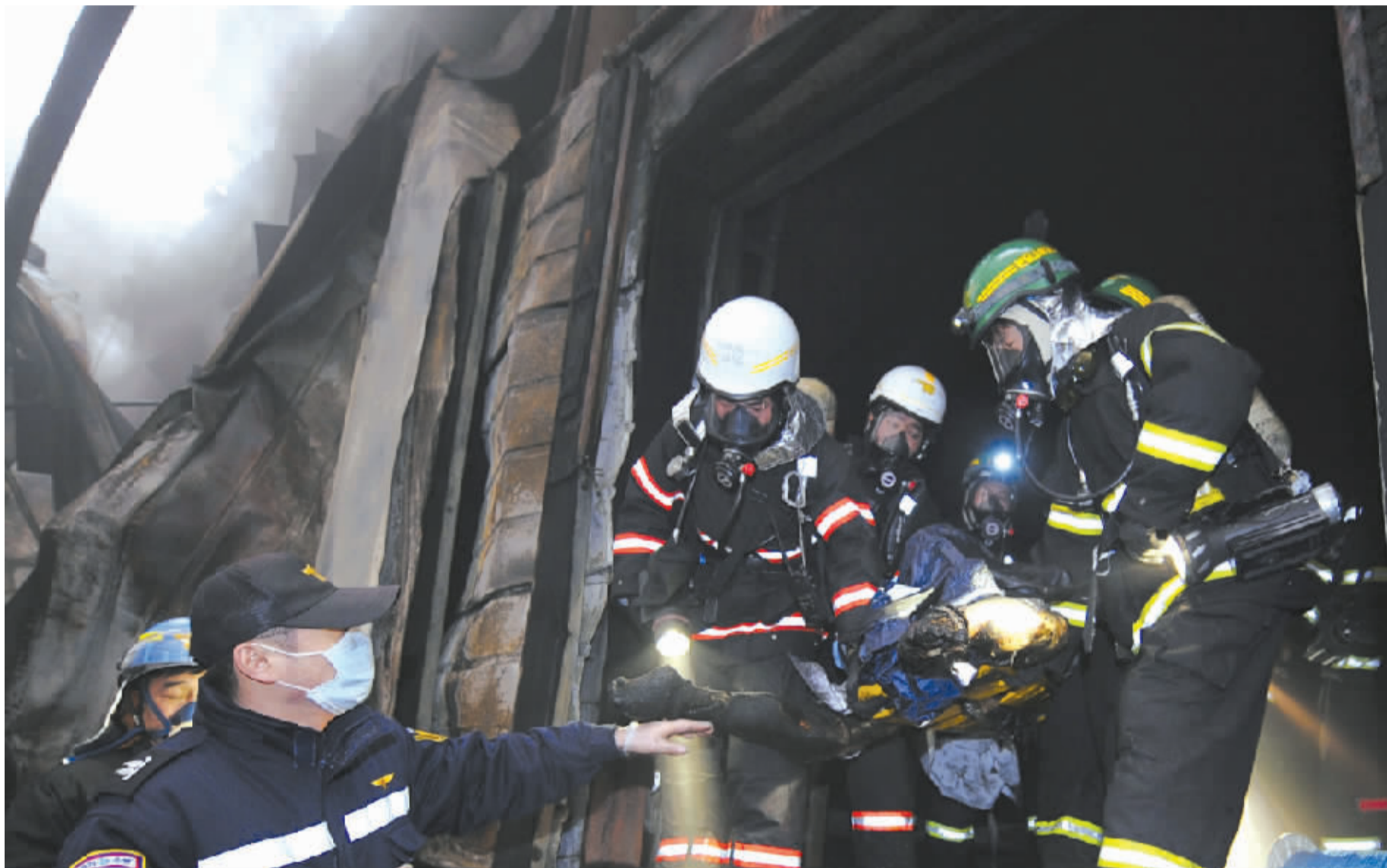
1月7日,在韩国京畿道利川市,消防员从爆炸现场抬出一具尸体。

中国驻韩国大使馆8日上午证实,有12名中国公民在7日韩国京畿道利川市发生的冷库爆炸事件中死亡,另有1名中国公民受重伤。