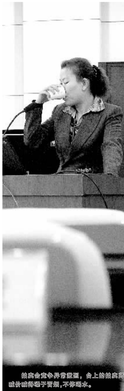
拍卖会竞争异常激烈,台上的拍卖师喊价喊得嗓子冒烟,不停喝水。

另外,农业部对国内22个城市水产品中氯霉素和孔雀石绿及硝基喹啉类代谢物污染状况进行的例行监测中,本市水产品三项检测结果全部合格,位居全国第一。