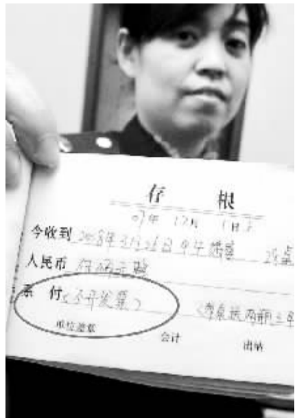
营业收据上明确注明“不开票”,明显存在偷漏税现象。

一是目前通胀压力比较大,国家已经出台相关政策调控物价,明年包括粮食在内的物价会稳定或略有下降。二是国家对农业特别是养殖业的补贴政策逐步落实到位。现在农民对猪、牛等牲畜的补栏积极性已经大大增加。就郑州的情况来说,奶牛补栏明显,各奶牛小区质量好点的小牛犊都被保留下来了,全国的形势大体如此。“据此分析,今年原奶收购价不会突破3.5元每公斤,也不会低于每公斤2.8元,而会维持在每公斤3.0元左右,也就是目前的价格水平,不只是牛奶,包括肉、蛋类的价格都会稳定下来。”第三个原因是,牛奶价格多年未动,现在的一波涨价属于补偿性涨价,涨到现在也不可能再大幅下落。“目前的价位基本合理,养牛户能赚到钱,奶企也不会亏损,从市场平衡的角度看,今年的奶价不会大起大落。”