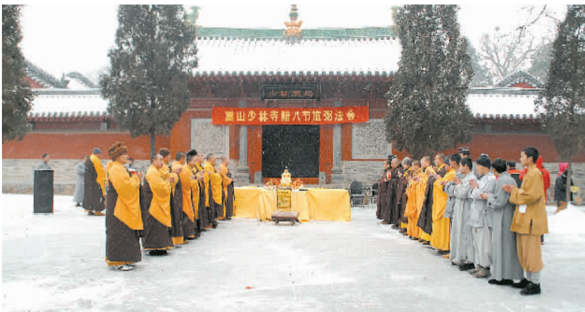
僧人们正在作法事祈福