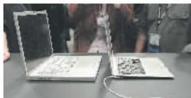
MacBook Air (右) 和以前出品的 MacBook Pro笔记本电脑。

据新华社电 美国苹果公司15日推出一款新型笔记本电脑,电脑拥有全尺寸键盘和13英寸液晶屏幕,但最厚处仅1.9厘米,最薄处0.4厘米,重量不超过1.5公斤。