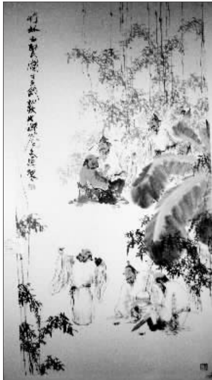
锦江画廊天淳作品《竹林七贤图》