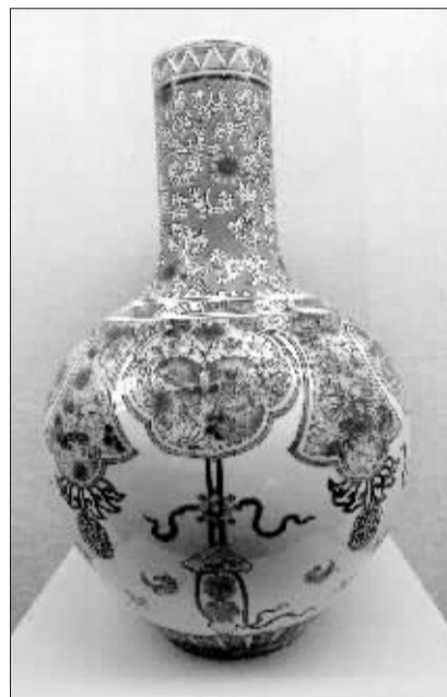
尊古堂清粉彩花蝶天球瓶