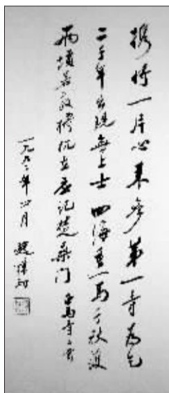
虚怀轩 赵朴初书法作品