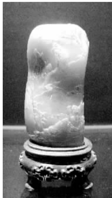
寿石轩 郭懋介作品《普渡众生》