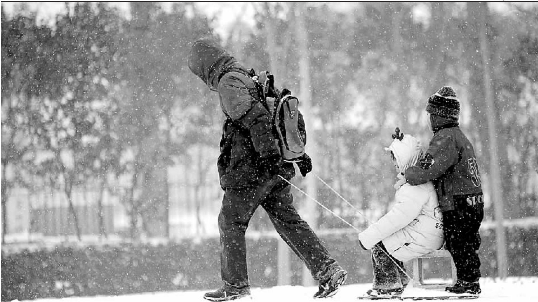
▲绿荫广场,人拉“雪橇”。