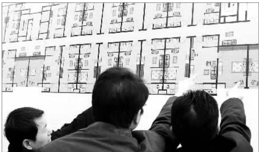
昨日,在新建廉租房的户型图前,几名主管领导在看设计是否合理。