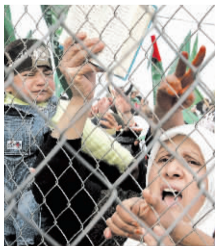
1月22日,巴勒斯坦人在加沙地带与埃及交界的拉法口岸集会。当日,数百名在拉法口岸集会的巴勒斯坦人与埃及军人发生冲突,造成数十人受伤。

联合国近东巴勒斯坦难民救济和工程处一位发言人21日警告说,由于救援物资无法运入加沙,该机构将在几天内被迫停止向加沙地带的巴勒斯坦人发放救济粮。