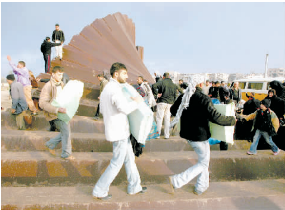
1月23日,在加沙地带南部与埃及交界的拉法边境口岸,巴勒斯坦人带着从埃及购买的日用品返回加沙。

1月23日,以色列对加沙的全面封锁进入第五天。加沙的供应品已非常紧缺。在巴勒斯坦武装人员将加沙与埃及边境墙炸毁之后,数万名走投无路的巴勒斯坦民众涌入埃及,穿梭于边境线两侧购买日常生活用品。由于担心加沙地带会爆发人道主义危机,以色列已承诺继续向加沙地带提供有限的供应品。