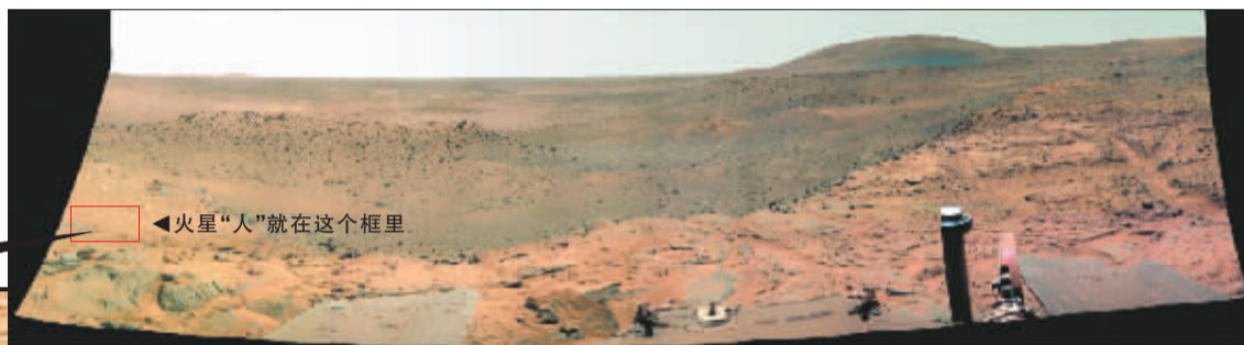
◀火星“人”就在这个框里

美国宇航局(NASA)“勇气”号火星探测器从火星表面传回来的一张照片显示，在火星的山丘上竟有一个人形身影，它既像是坐在一块石头上休憩，又像迈开脚步正往山下走。