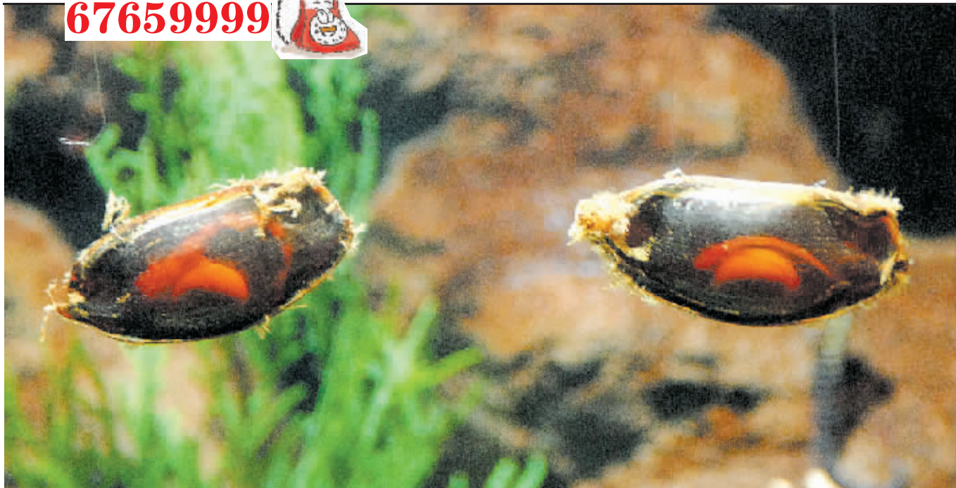
它们吸着卵黄的营养,慢慢发育成形,3个月后会破壳而出成为真正的环纹虎鲨。