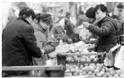
1月28日,高寨蔬菜批发市场内,市民在选购新鲜蔬菜。