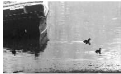
小野鸭寻找食物。

金水河管理处游园护理员张先生说:“这群水鸟都是小野鸭,现在飞到这里,就是因为这一段河水没有结冰,水中还有不少水草。这段河水上游200米,是从污水处理厂处理过的中水入河口,水温较高,所以这段河面不结冰。而再向下走,就结冰了。向上去,水温太高,野鸭也不去,只有这段,水温对它们正合适,所以,它们就从其他地方跑来找吃的了。”