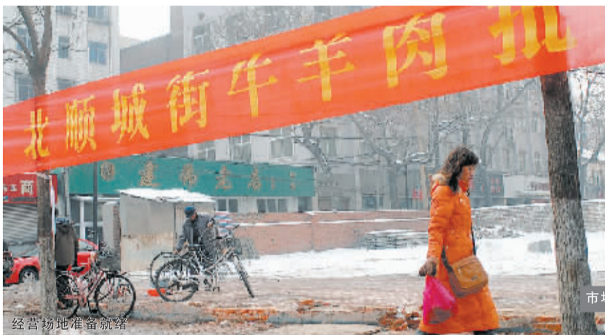
经营场地准备就绪

具体方位是:沿商城路往东不远一条向南的路即为北顺城街,沿着这条路往南不远,一条向西的小路紧靠着现在的百盛广场位置后边,这条路叫团结路,团结路与北顺城街西北角的一块空地,即为拟设的市场。与团结路相连,北顺城街路东一条深胡同即为裴昌庙街。