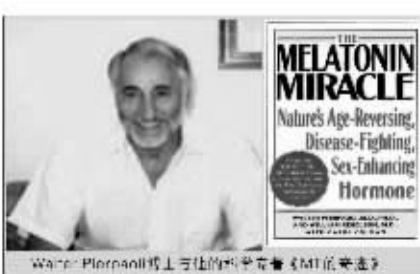
在全球掀起脑白金热潮的华尔博士和他的著作《脑白金奇迹》

咨询电话: 8008206020, 8008207770, 0371-63512770