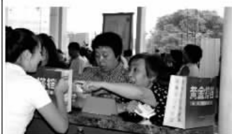
黄金搭档的销售火爆场面一点都不逊色于脑白金