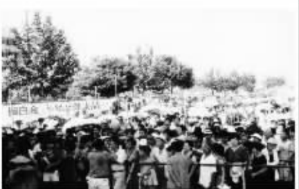
脑白金在中国上市时的火爆场面