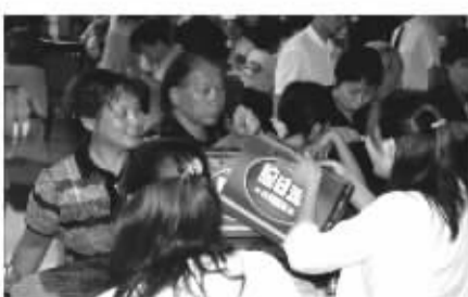
脑白金火爆了十年,直到今天还是礼品的首选,每年过节很多商场都面临卖断货的压力