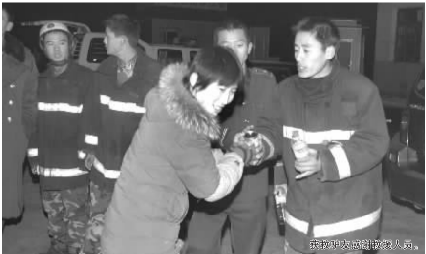
获救驴友感谢救援人员。