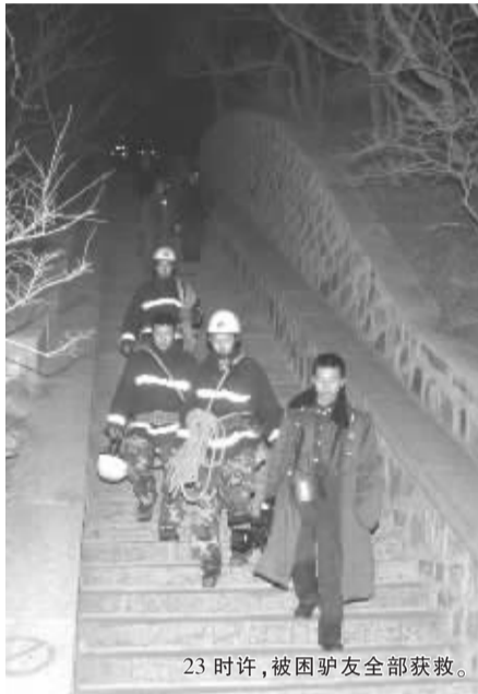
23时许, 被困驴友全部获救。