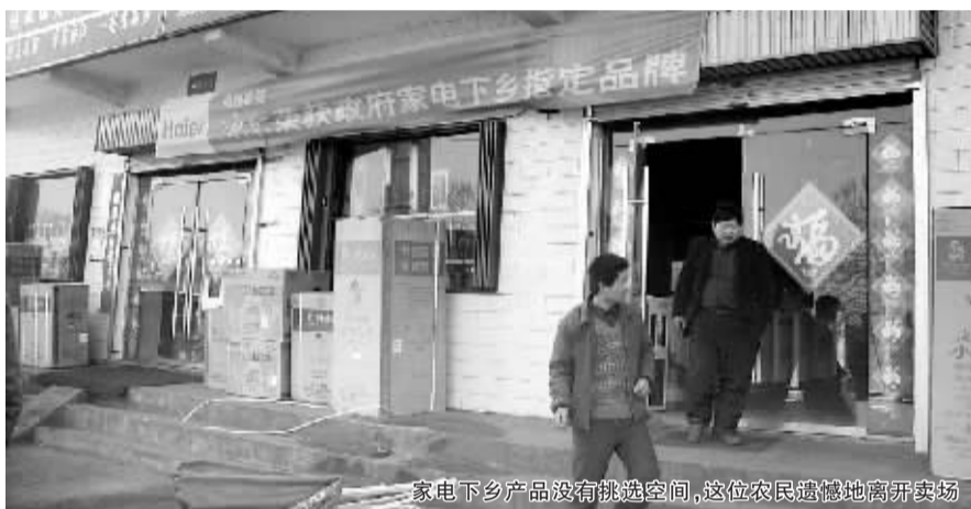
家电下乡产品没有挑选空间，这位农民遗憾地离开卖场

场上只有一台29英寸的电视机，其他型号都没有。而在卖场摆放的宣传彩页上，宣称参加家电下乡的电视机品牌有10种。