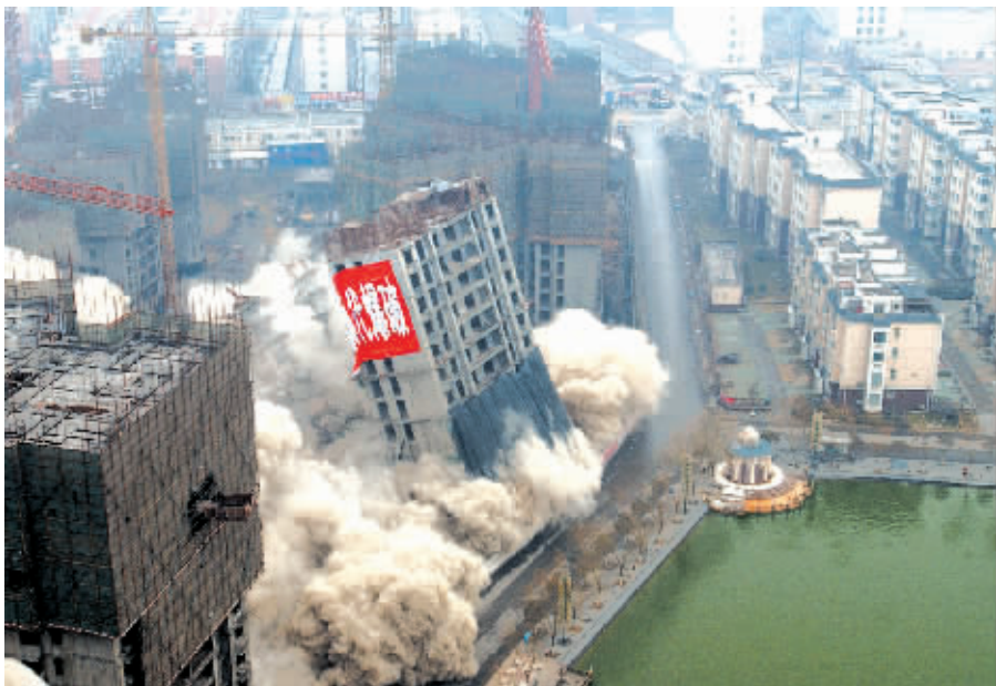
昨日14时，帝湖已建14层高的建筑准点起爆。