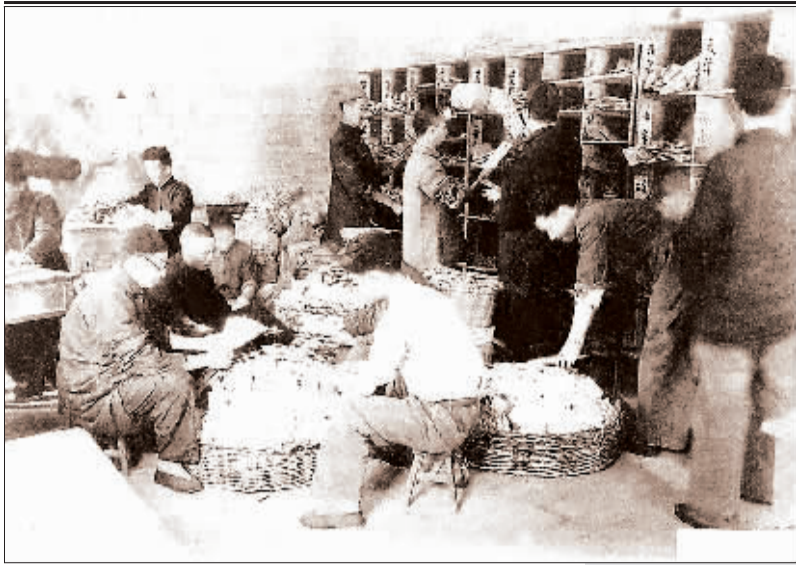
在以前的邮局里,搬信、分信、投信分工明确,那时候一定要有充足的人力才能让效率提高。