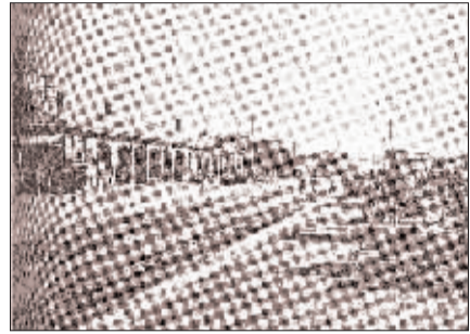
上世纪20年代的郑州火车站。和从前相比,唯一不变的是在站台上等候的那份归家的心情。