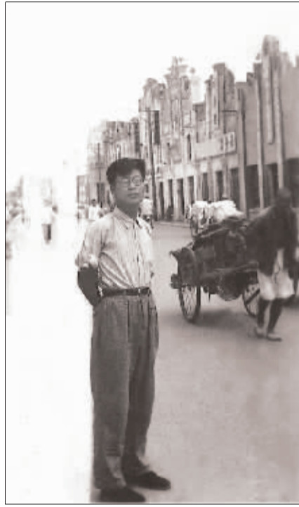
1952年的郑州福寿街,现英苑商场处。看看如今的福寿街“车水马龙”,似乎有点怀念当年的“宁静”。