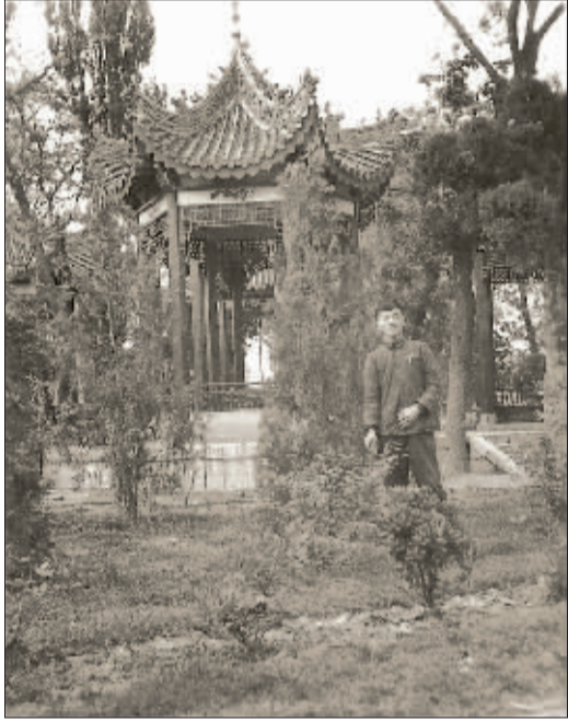
1957年,拍摄于人民公园纪念亭,如今景色依旧。