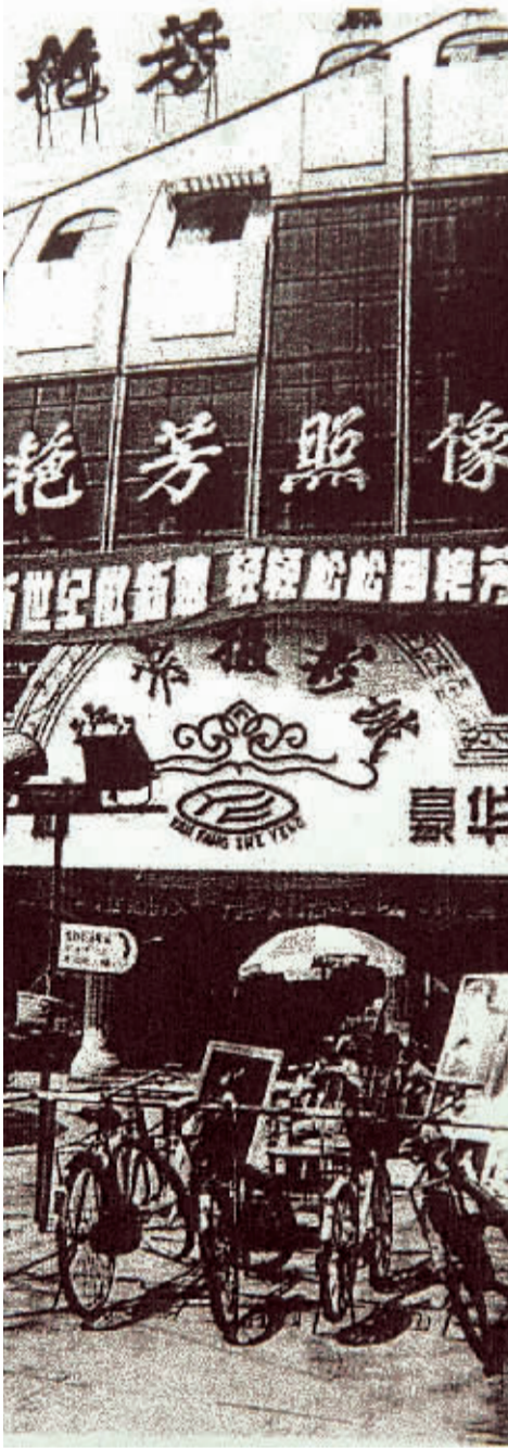
艳芳照相馆二七广场老店面

京士照相馆是1956年11月开业的，在郑州已经存在了52年。在上世纪的很长一段时间里曾风光一时，在历经了国有、集体、公司化改革之后，大部分照相馆都难觅踪迹，如今只剩下京士和艳芳两家。