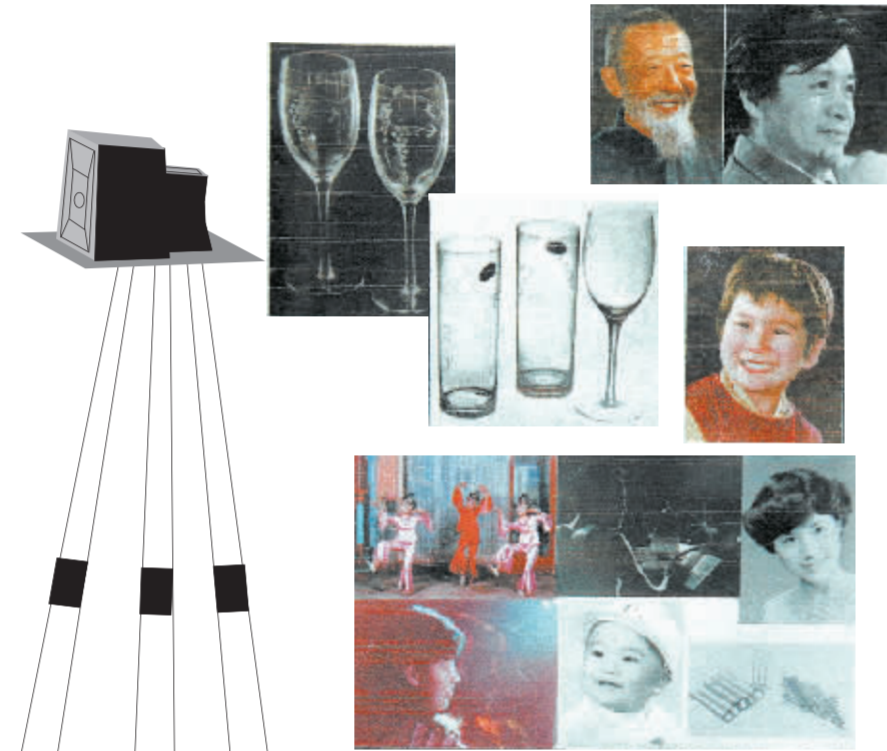
艳芳照相馆上世纪80年代的获奖作品