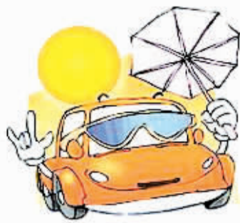
黄帽子爱车养护课堂