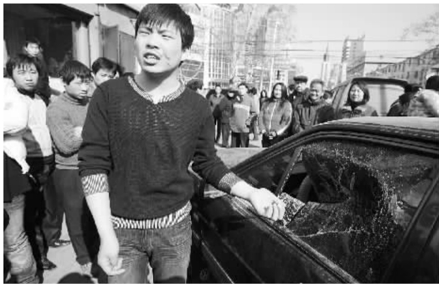
被撞车上的一名男子称遭肇事司机殴打。