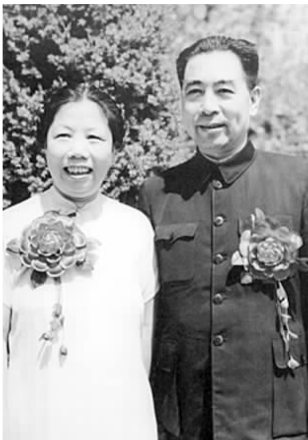
周恩来和邓颖超在一起