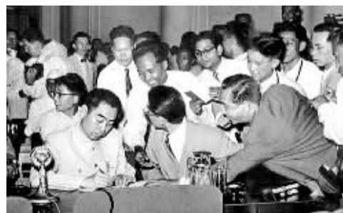
1955年4月，周恩来率代表团参加万隆会议