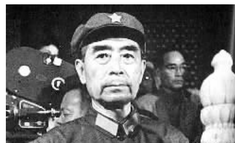
文化大革命中的周恩来