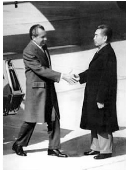
1972年2月21日，尼克松来访

尼克松后来在回忆录中是这样描述这一历史时刻的：周恩来站在舷梯脚前，在寒风中不戴帽子。厚厚的大衣也掩盖不住他的瘦弱。我们下梯走到快一半时，他开始鼓掌。我略停一下，也按中国的习惯鼓掌相报。我知道，1954年在日内瓦会议时，福斯特·杜勒斯拒绝同周握手，因此，我走完梯级时决心伸出我的手，一边向他走去。当我们的手相握时，一个时代结束了，另一个时代开始了。