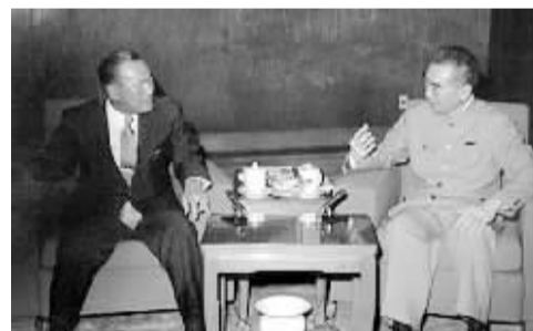
日本首相田中角荣来访

其实周恩来何尝不需要休息，他曾说过：“我不能坐，一坐下就会睡着。”面对纷繁的国事和别人无法代劳的难事，他又事必躬亲。1974年上半年，他的癌症已开始扩散，但是据办公记录统计，仍有半数以上的日子工作在18小时以上。