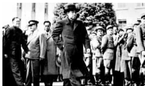
1954年4月26日，周率领代表团出席日内瓦会议

周恩来在贯彻毛泽东的“文革”意图的同时，又尽力支撑危局，对“文革”的狂暴起到了某种缓冲制衡的作用。邓小平后来在党内高层谈到周恩来在文化大革命中的作用时，曾说过：如果没有总理，文化大革命的局面可能更糟。