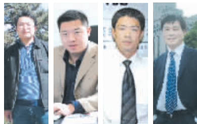
谈 新格局彰显机遇 新人居脉动楼市 直击“新格局推动新人居”联席会议