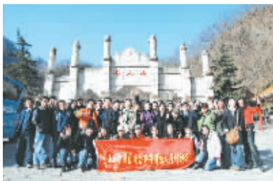
高 山高人为峰 论剑新人居 中原地产精英聚首石人山纵论郑州新人居

第十届(2008春季)郑州住交会招商完美收官 数十家一线房企携精品楼盘现场全新绽放