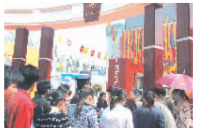
论 下周住交会特刊预告 新机遇下的中原新人居元年