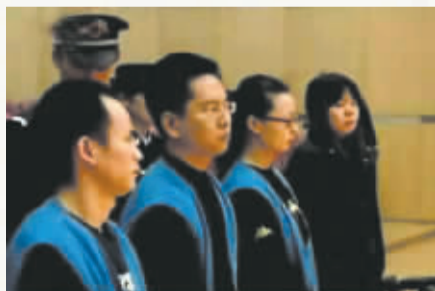
四被告之一的25岁女性可能面临10年以上有期徒刑或者无期徒刑。

4日晚,记者连线了湖南骄阳律师事务所廖霄翔。他认为,依照法律认定他们构成了传播淫秽物品牟利罪并没有问题,不过,如果要判10年的话还是过重了点。首先,根据现有的网络技术,一个人对一张图片点击可以多次,还有可能因网络堵塞的原因点击没有成功,因此,点击率与传播人次不能等同,25万余次应当大打折扣。其次,点击量与实际点击量是两个不同的概念。只要实际点击量没有达到25万次以上,法院就应当适当轻判。