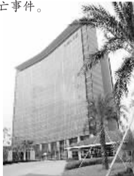
深圳坂田研发基地科研中心

据了解,这是今年发生的第二起华为员工坠楼事件,也是华为公司第38起员工非正常死亡事件。