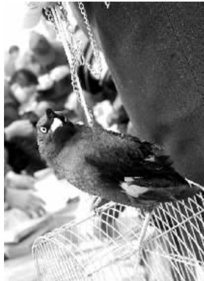
就是这只小鸟,主人想拿它换台笔记本电脑。

互动方式:您可拨打本报热线67659999,发送邮件到本报信箱cjj@zzwb.sina.net,加入本报换客联盟QQ群:56288092、41482193、35050094、36887306、24737162,发布您的换物信息,讲述您的换物故事,交流您的换物心得。