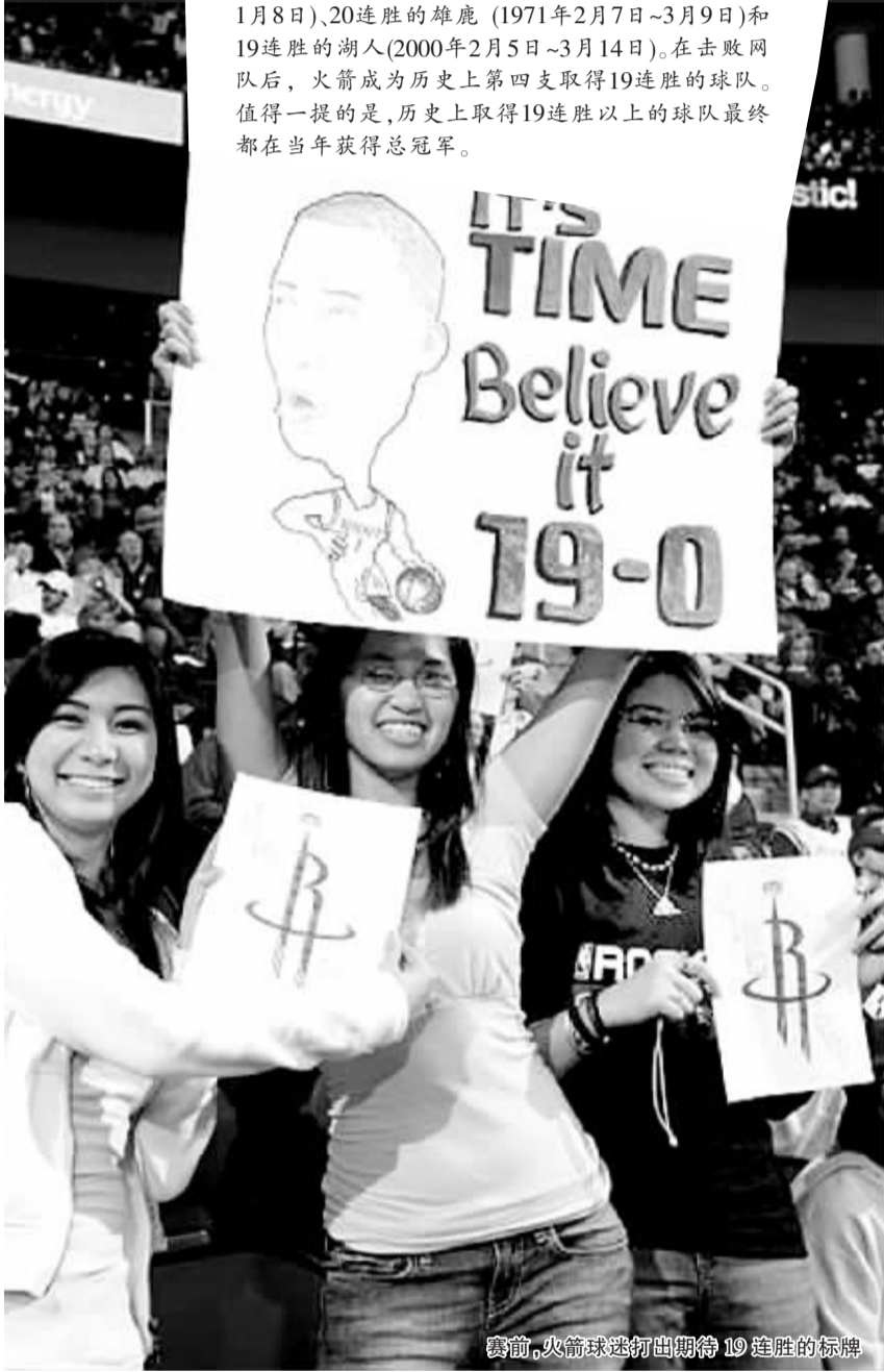
赛前,火箭球迷打出期待19连胜的标牌

北京时间昨天,手握18连胜傲人战绩的休斯敦火箭主场迎战了基德的网队,最终以91:73轻松战胜对手,豪取NBA历史上第三长的19场连胜。刚刚获选上周最佳的麦蒂拿下19分。在火箭之前,NBA历史上只有三支球队取得过19场以上的连胜。它们分别是33连胜的湖人(1971年11月6日~1972年1月8日)、20连胜的雄鹿(1971年2月7日~3月9日)和19连胜的湖人(2000年2月5日~3月14日)。在击败网队后,火箭成为历史上第四支取得19连胜的球队。值得一提的是,历史上取得19连胜以上的球队最终都在当年获得总冠军。