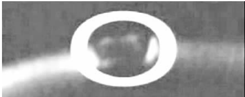
◀▲您要是有兴趣,不妨登陆 http://www.youtube.com/watch?v=iL_4Tnqe2Xl ,自己看看这个 UFO 是真是假。