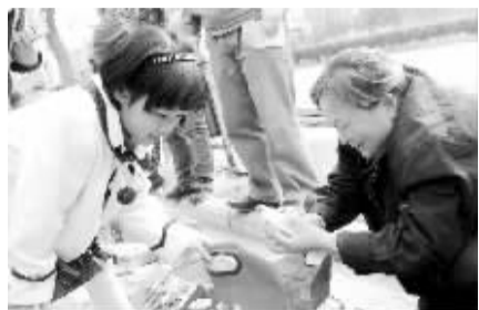
晚报记者 潘默 汪永森/文

16日上午9时,本报第二场换客大会在老地点绿城广场西南角如期举行。换客们在自己的地盘上无拘无束地进行交流,其中不少小换客活跃在现场,寻觅自己中意的物品。