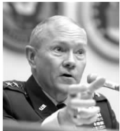
登普西号称最具伊拉克战争经验的美国将军之一

据新华社电 马丁·登普西作为美国军队号称最具伊拉克战争经验的将军之一,28 日接替威廉·法伦,出任美军中央司令部司令,管辖范围包括伊拉克战争和阿富汗战争。