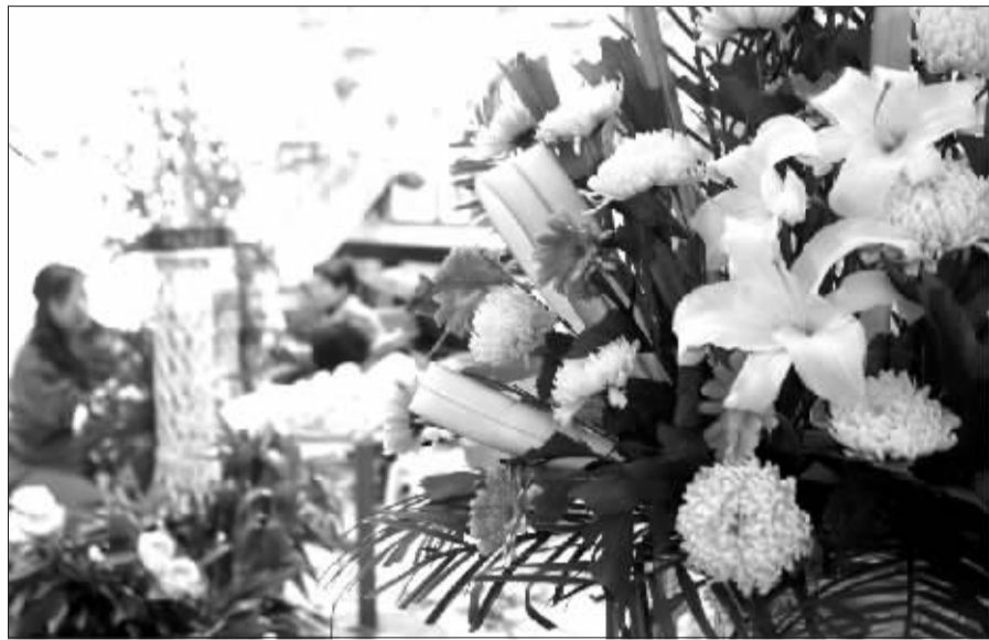
花卉市场内,花工正在忙着扎制清明花篮。

然而,也有部分家长担心考试内容过多,会给孩子增加更大的负担。对此,市教育局有关负责人说,实验操作考试的分值是15分,只要是平时认真上实验课的学生,一般都不会感觉太难。