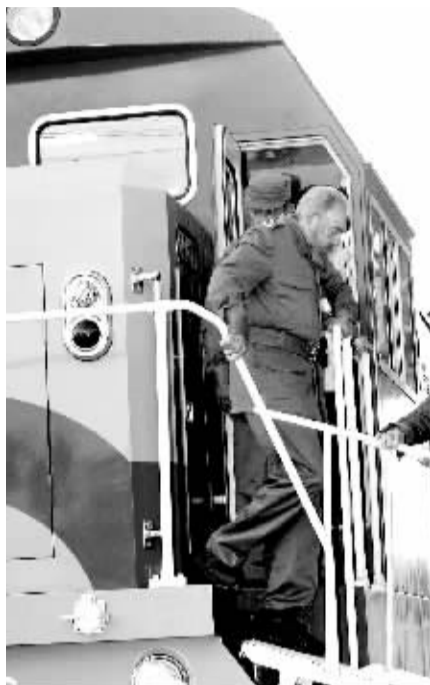
古巴改革始于卡斯特罗执政晚期。图为2006年1月14日，卡斯特罗在哈瓦那火车站体验中国造火车机车。

这项解禁决定是2月新上任的古巴领导人劳尔·卡斯特的最新举动，放宽一些几十年来控制人们生活的法规和官僚主义做法，以促进消费、改善人们日常生活。上星期，他允许古巴人购买手机，过去只有外国人和政府主要官员可以拥有手机。预料其他被禁止的物品例如DVD播放机、电脑和微波炉都将于下个月解禁。 李影